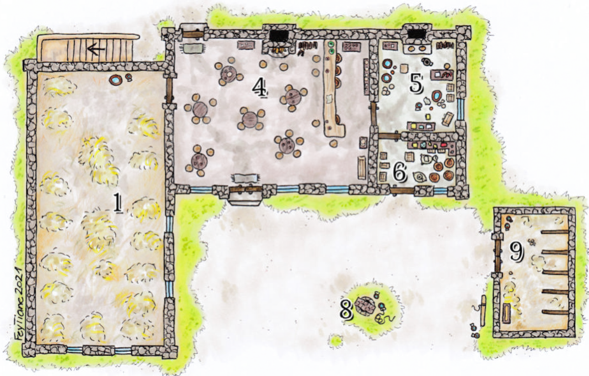
Oben: Gasthaus „Zur Letzten Laterne“ Erdgeschoss