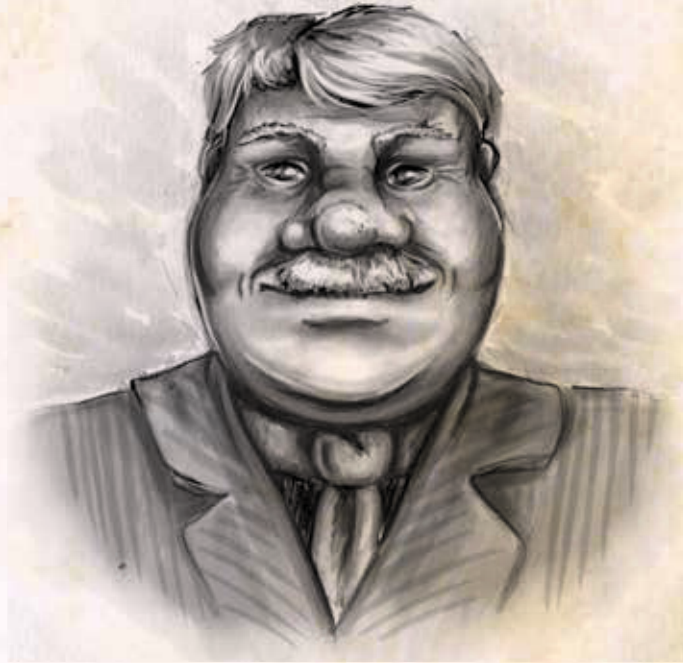
Bürgermeister von Drygolstadt

Alter: 51 Jahre, Haare: Blond, Augen: Blau Körpergröße: 177 cm, Geschlecht: Männlich Besondere Merkmale: Degenerierter linker Arm.